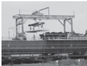
PC版架設機(門型タイプ)