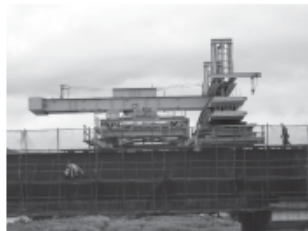
PC版架設機(旋回タイプ)