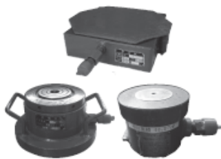
油圧ジャッキ(各種)